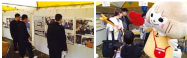
今年は「あかはなちゃん」(県共同募金会マスコット)も登場!