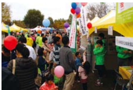
肌寒い天候にもかかわらず、会場には多くの方にお越しいただきました

出展ブースでは、キャンペーンの風船や各種グッズを配布するとともに、昨年度好評だったぬり絵コーナー設置し、親子連れの方などでブース周辺は大いににぎわいました。